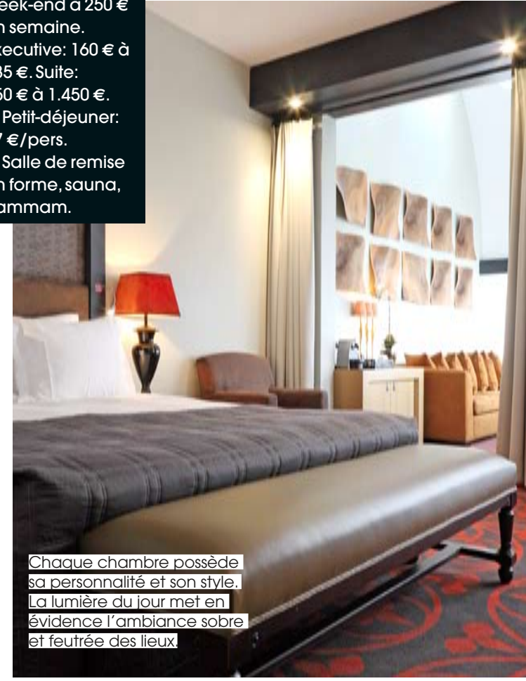
Chaque chambre possède sa personnalité et son style. La lumière du jour met en évidence l'ambiance sobre et feutrée des lieux.

Construit sur les vestiges d'un monastère dominicain du XV e siècle, l'hôtel a été la demeure de Jacques Louis David, peintre exilé à Bruxelles - il y meurt en 1825 - pendant la Restauration. De ces époques, il reste une façade classée, intégrée dans le nouvel ensemble. Passé le seuil de l'hôtel, on découvre les volumes, les hauts plafonds et la cour intérieure, conçus pour rappeler le couvent