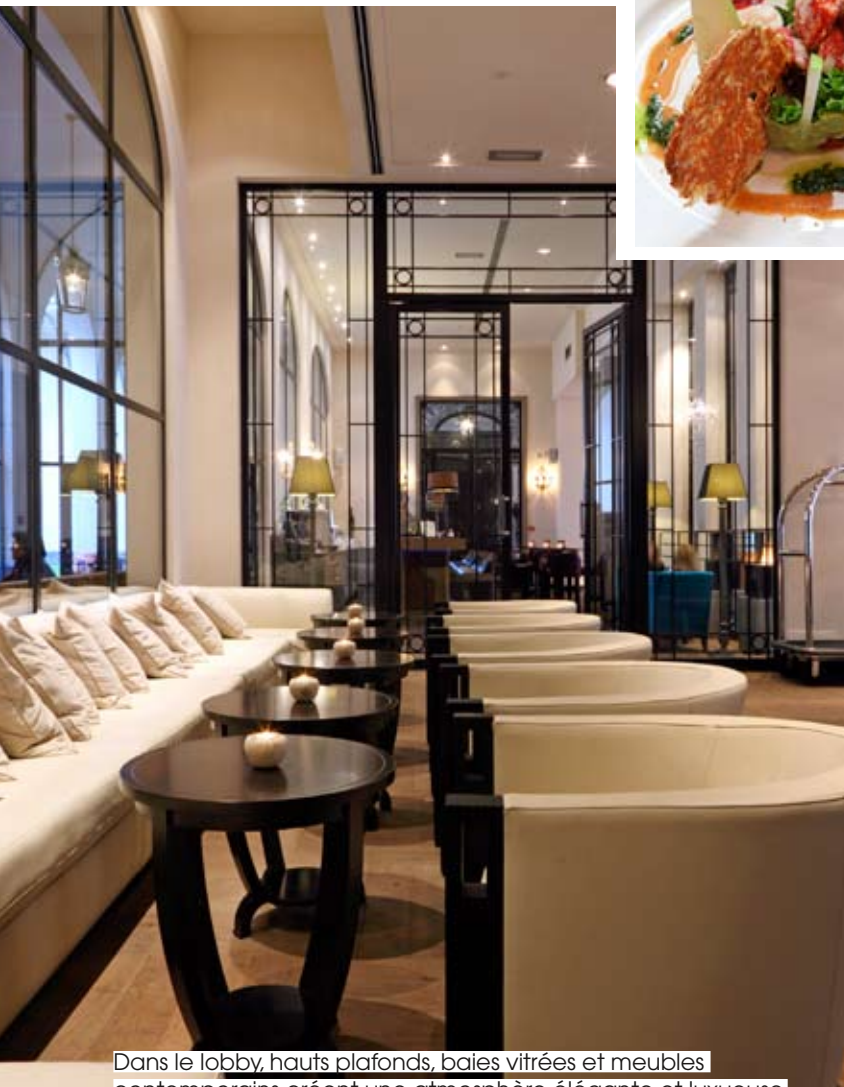
Dans le lobby, hauts plafonds, baies vitrées et meubles contemporains créent une atmosphère élégante et luxueuse.

Disposant de tout le confort moderne, elles sont équipées de luxueuses salles de bains. Répartie sur deux étages, la suite David occupe l'ancien atelier du peintre. La suite Grand-Place est au dernier étage. Véritable appartement, elle possède sa salle à manger, son salon, son feu ouvert et son dressing. Et offre une vue imprenable sur la tour de l'Hôtel de ville. En façade, la suite Opéra donne sur le Théâtre de la Monnaie.