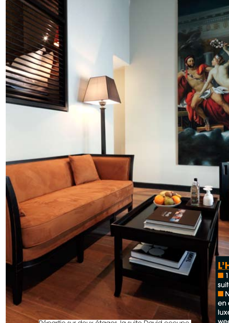
Répartie sur deux étages, la suite David occupe l'ancien atelier du peintre.